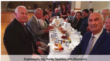
Εορτασμός της Αγίας Τριάδος στη Βοστώνη