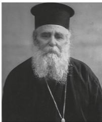
Η ΦΩΝΗ ΤΗΣ ΝΥΜΦΑΣΙΑΣ 31

Πρόκειται για την κατάθεση, όπως τόνισε, προς την αρμόδια Επιτροπή της Ιεράς Συνόδου της Εκκλησίας της Ελλάδος του σχετικού φακέλου προς αγιοκατάταξη του ηγιασμένου π. Γερβασίου Παρασκευόπουλου.