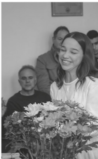
Η ΦΩΝΗ ΤΗΣ ΝΥΜΦΑΣΙΑΣ 12